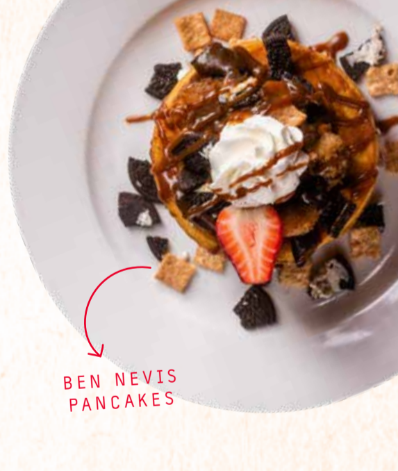
BEN NEVIS PANCAKES