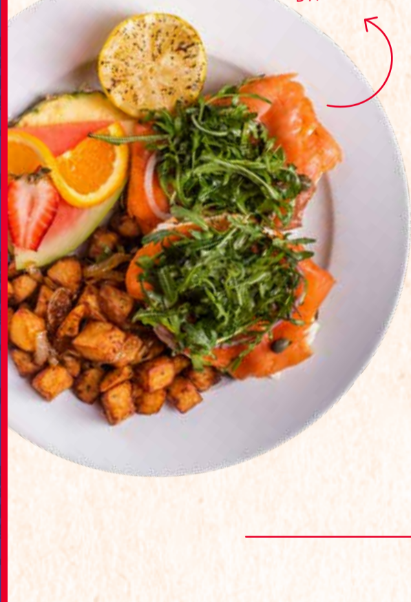
THE QUEEN'S BAGEL