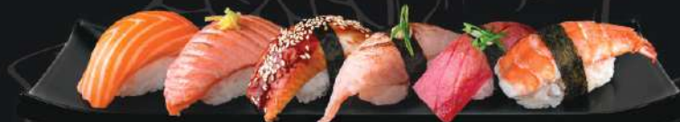
SÉLECTION DE NIGIRIS