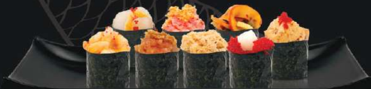
SÉLECTION DE GUNKANS