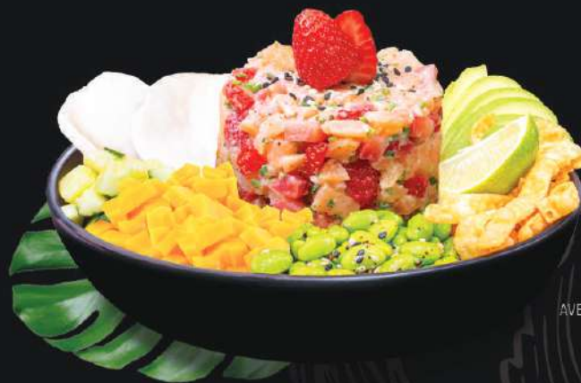
POKE BOL AVEC TARTARE SAUMON FRAISE