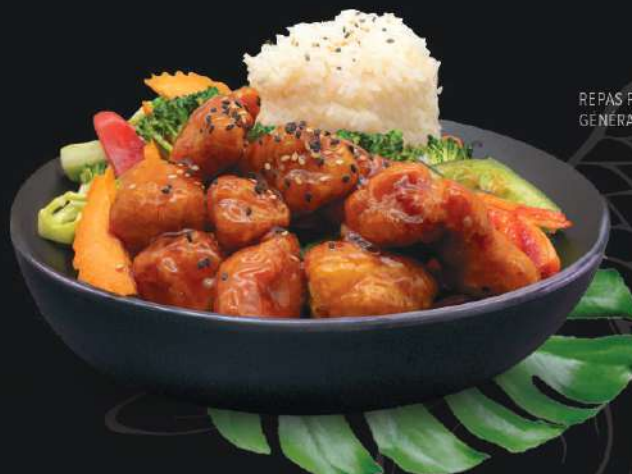
REPAS POULET GÉNÉRAL TAO