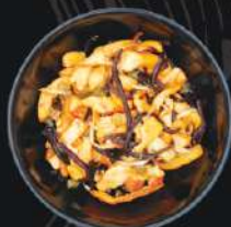
SALADE DE CALMARS GRAND FORMAT